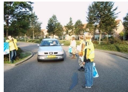
Verkeersactie uitgevoerd door kinderen en de verkeersouder

Het is belangrijk voor kinderen om te leren deelnemen aan het verkeer. Dit doen zij niet op de achterbank van uw auto, maar juist door lopend of op de fiets naar school te gaan. Zeker de kinderen in de groepen 5 t/m 8 moeten hierin vaardig worden gezien de overstap naar het voortgezet onderwijs. De fietsvaardigheid en verkeerskennis worden in groep 7 getest door het landelijk verkeersexamen van VVN (Veilig Verkeer Nederland). Wij raden u aan uw kind elke dag, al dan niet onder begeleiding, lopend of op de fiets naar school te laten gaan. Kinderen die deelnemen aan het verkeer doen namelijk meer ervaring op en zijn beter in staat veilig en zelfstandig aan het verkeer deel te nemen.