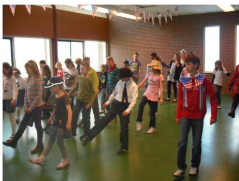
Leren door doen: line dancing oefenen tijdens de afsluiting van het thema: Amerika

Doordat wij werken met thema's in groep 1 t/m 3 en het werken met Topondernemers in groep 4 t/m 8, heeft uw kind inbreng in de uitwerking van het onderwijs. Deze inbreng ontstaat uit de verschillende leerstijlen, interesses en talenten die kinderen hebben. Hierdoor is de leeromgeving rijk aan diversiteit en enorm uitdagend. Doordat uw kind met andere kinderen samenwerkt, vindt er uitwisseling van kennis, leerstijlen en interesses plaats en wordt het positieve effect van samenwerken leren duidelijk zichtbaar. Dit onderwerp lichten we verder toe in hoofdstuk 6 Schoolklimaat.