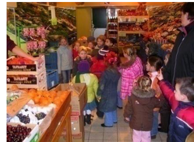
Op bezoek bij de groenteboer in het kader van het thema: Het winkelcentrum

De school schrijft ieder jaar in op vier sporttoernooien en organiseert ook zelf ieder jaar een sportdag . Onze vakleerkracht bewegingsonderwijs organiseert het hele jaar door enkele naschoolse sportieve activiteiten waaraan uw kind gratis mag deelnemen. Ook worden er gedurende het jaar