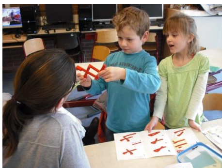
Samen proefjes doen tijdens Topondernemers

Concluderend: de cursorische onderdelen staan in dienst van het thematisch aanbod, aangezien wij in deze onderdelen uw kind