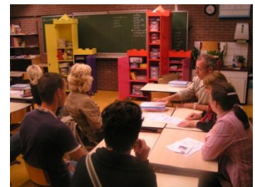
De workshop techniek

In de eerste weken van ieder schooljaar wordt u in de gelegenheid gesteld aan te schuiven in de klas van uw kind. Tijdens deze ochtend ervaart u hoe uw kind bij ons les krijgt.