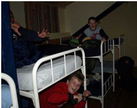
Dikke pret tijdens kamp groep 8 op Texel

voor een aantal groepen sportactiviteiten georganiseerd waar bepaalde groepen aan deelnemen.