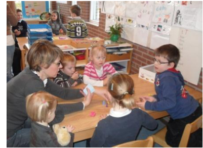
Samen spelletjes spelen, leren omgaan met winnen en verliezen

Daarnaast vinden wij het belangrijk dat uw kind op respectvolle wijze met de medemens leert omgaan. Respect voor de medemens uit zich in openheid en eerlijkheid naar elkaar toe. Ieder mens is uniek geschapen en daarom de moeite waard om naar te luisteren en van te leren. Dit geldt voor alle onderlinge relaties op school, te weten: