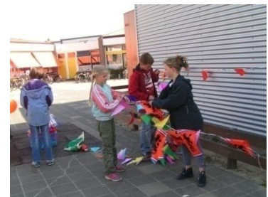
Samen de spullen opruimen die zijn gebruikt bij het versieren van het plein

Deze afspraken staan mooi op papier, maar wat als ze worden overtreden. Onze handelwijze staat omschreven in het aanvullende protocol “grenzen van gedrag”, welke in het schoolveiligheidsplan is opgenomen.